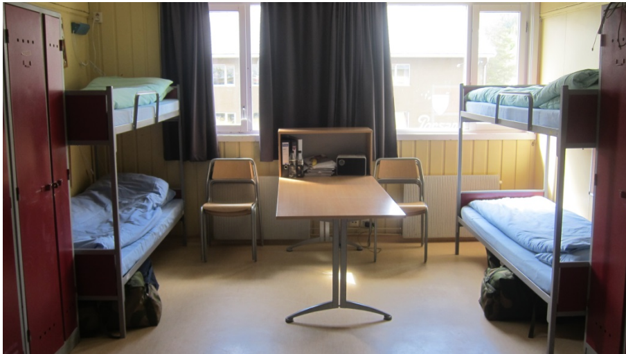
Figur 2.2 Eksempel på deler av et seksmannsrom. Hvilken seng er forskerens?

Dette andre feltarbeidet, i september, var også av én ukes varighet (7 netter), der det grunnet sprengt kapasitet på kasernene, ikke var noen ledige senger. Dermed sov forskeren på kjønnsblandet rom på en feltseng midt i rommet. Til tross for at dette førte til trangere og mer ukomfortable forhold for soldatene på rommet, lot de seg ikke merke med det. I alle fall ikke overfor forskeren. Som vi vil komme tilbake til senere i rapporten, virker det som om motiverte soldater har høy toleranseterskel for endringer og utfordringer. Disse soldatene var litt over halvveis i avtjent førstegangstjeneste.