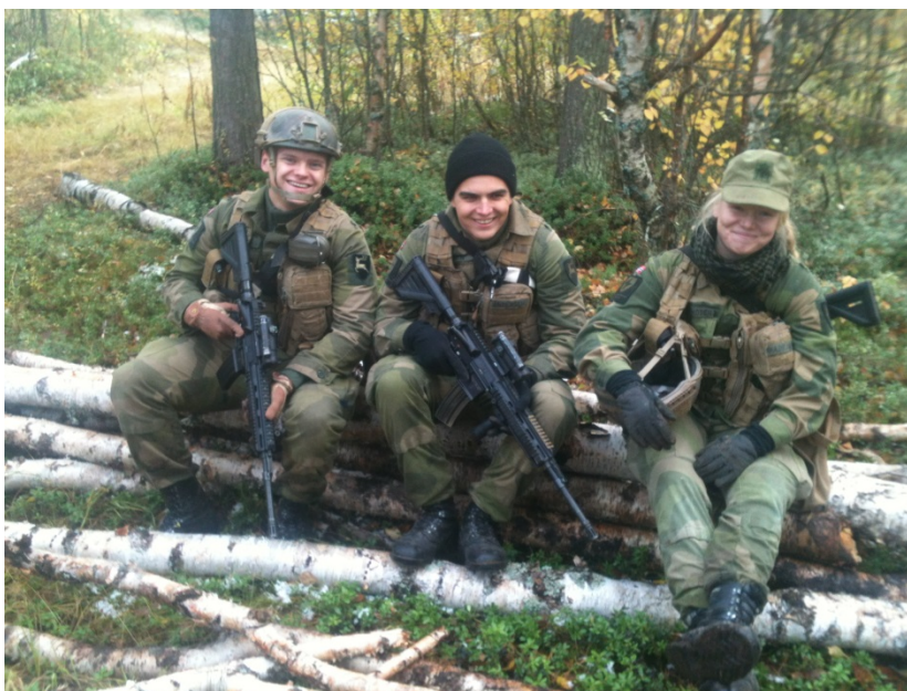
Figur 2.4 De tre musketerer.

Empirien kan vise oss ulike perspektiv, samt understreke viktigheten av å snakke med personer som skal leve med beslutningstakernes avgjørelser. Gjennom empirien kan vi høre deres stemmer, som igjen kan gi et bredere beslutningsgrunnlag. Selv om en soldat eller offiser skulle være uenig i ulike implementeringer eller avgjørelser, vil vedkommende kunne være mer lojal mot en beslutning der han eller hun har fått ytret sin mening, enn mot en beslutning der vedkommende ikke har hatt noen påvirkningsmuligheter. Flere av informantene i denne studien uttrykker frustrasjon over politiske og byråkratiske beslutninger tatt uten å spørre dem det gjelder. Denne rapporten, i tillegg til Oxfordstudien og tidligere studier fra Forskning på årskull, kan være nyttige bidrag til å øke beslutningsgrunnlaget.