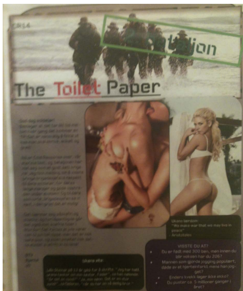
Figur 5.1 Eksempel på The Toilet Paper med bilder av lettkleddede kvinner. Dette var det “drøyeste” eksempelet.

“Avisene” inneholdt ellers informasjon som førstehjelp, militærtekniske fakta og vitsetegninger. Sett fra forskerens ståsted var ingen av bildene støtende eller sjokkerende, men det skurret likevel at slike hang både på jente- og guttotoalettene. Alle informantene fikk dermed spørsmål om dette under intervjuene; “Hva synes du om de bildene?”, “Plager de deg?”, “Hvorfor/hvorfor ikke?”, “Har bildene en positiv funksjon?”, “Er disse bildene med på å redusere de mannlige soldatenes seksuelle behov og eventuelle frustrasjon?”. Forskeren ønsket å finne ut om bildene hadde en viktig funksjon som hun kanskje ikke umiddelbart forsto. Bildene i seg selv var som nevnt verken grove eller støtende, men på bakgrunn av diskusjonen rundt maskulinitetskulturer er det viktig å sette spørsmålstegn ved bruksnyten av dem. Hva slags betydning har de egentlig?