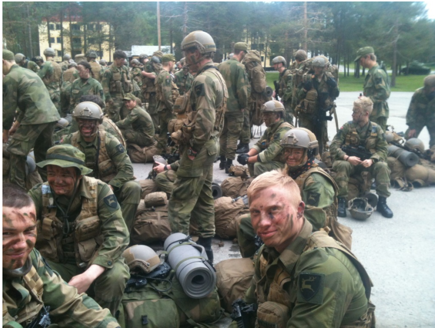
Figur 2.1 Klare for femmilsmarsj.

deler erfaringer og meninger med forskeren, er avgjørende for et så godt resultat som mulig. Dette må forskeren søke å få til uten å “go native”, uten å prøve å bli “en av dem”.