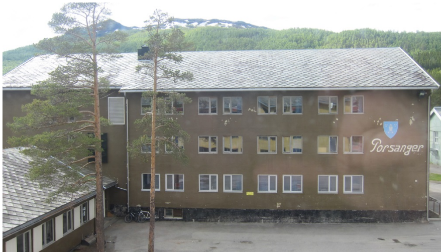
Figur 2.3 Norges eldste kaserne, Skjold.